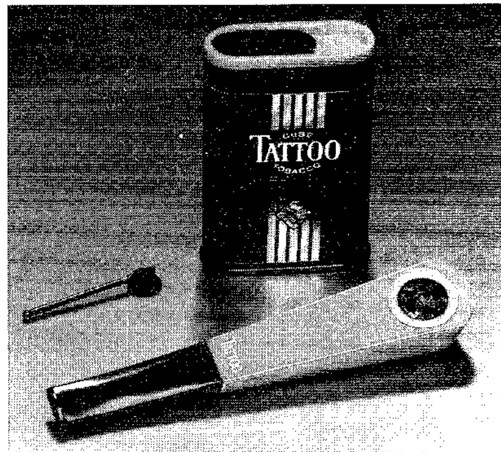
Tattoo, het begin jaren negentig geïntroduceerde tabakspijpje, redde het niet ondanks veel reclame ervoor – en daarmee verdween ook het woord in deze betekenis.

Het experiment gaf ons ook de gelegenheid het verband te bestuderen tussen de manier waarop de leer-